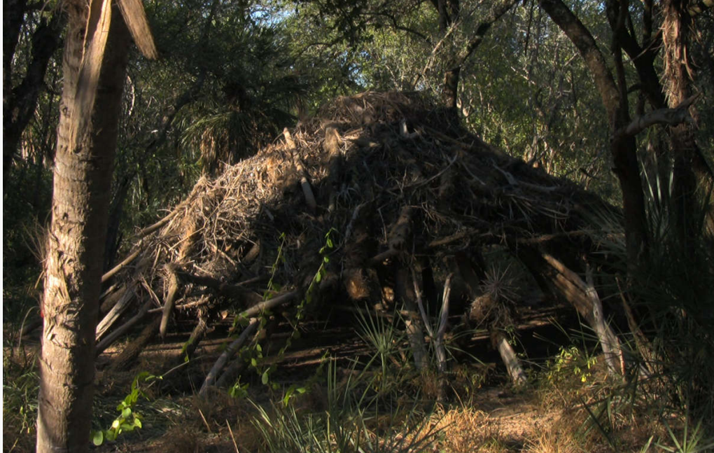
Una casa abandonada en el Chaco paraguayo perteneciente a indígenas aislados ayoreo-totobiegosodes.

El ritual ayoreo más importante recibe el nombre de asojna , el chotacabras . El primer canto de este ave anunciaba la llegada de la estación lluviosa y un mes de celebraciones y festejos.