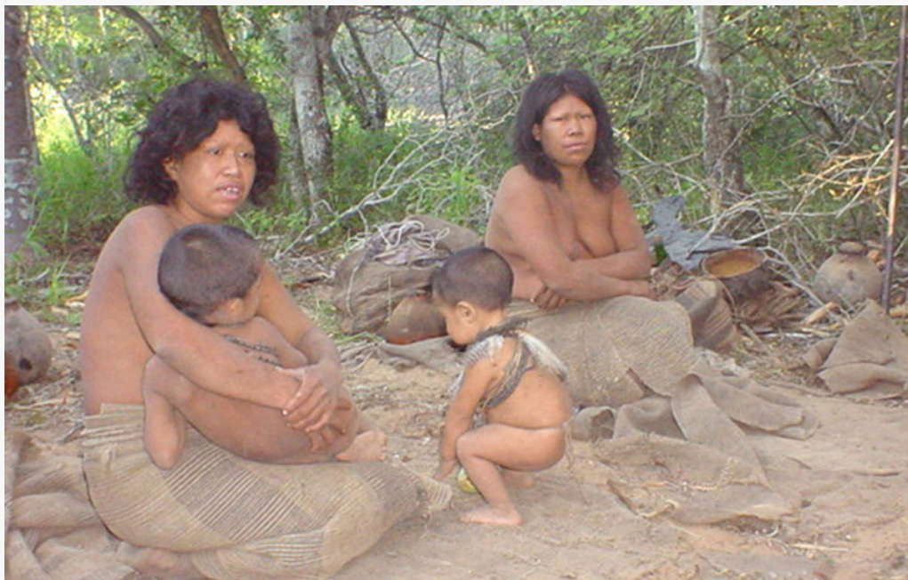
Miembros del grupo ayoreo-totobiegosode en Paraguay el día de su primer contacto en 2004.

Cuatro o cinco familias viven juntas en una casa comunal en el bosque. Un pilar central de madera da soporte a una estructura abovedada formada por ramas más pequeñas, y coronada por barro seco.