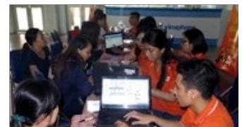
GIAO THÔNG NaN/NaN/NaN Hơn 72.000 vé tàu Tết Đinh Dậu được đặt qua mạng thành công