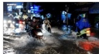
MÔI TRƯỜNG NaN/NaN/NaN Đêm nay mưa dông diễn ra cả trên đất liền và biển, để phòng tố lốc