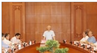
CHÍNH TRỊ NaN/NaN/NaN Đưa sáu vụ đại án tham nhũng ra xét xử trong những tháng cuối năm 2016