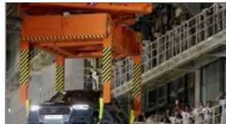
ÔTÔ-XE MÁY NaN/NaN/NaN Hãng xe sang Audi khai trương nhà máy trị giá 1,3 tỷ USD