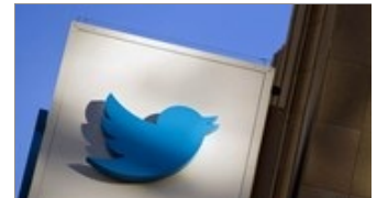
CÔNG NGHỆ NaN/NaN/NaN Google tham vấn giới tài chính để bỏ thầu mua lại Twitter