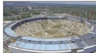
CÔNG NGHỆ NaN/NaN/NaN Choáng ngợp với đại bản doanh hình đĩa bay mới của Apple