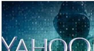
CÔNG NGHỆ NaN/NaN/NaN Tin tức có thể đã thực sự đánh cắp hơn 1 tỷ tài khoản Yahoo