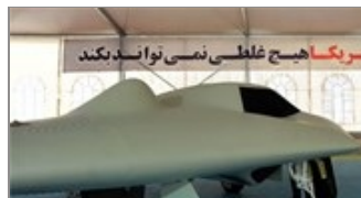
TRUNG ĐÔNG NaN/NaN/NaN Iran có máy bay tấn công không người lái tương tự vũ khí Mỹ