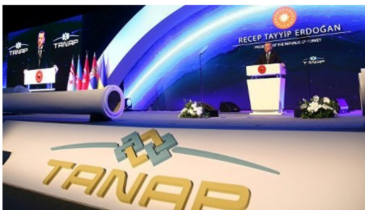
В Турции открыли газопровод в обход России