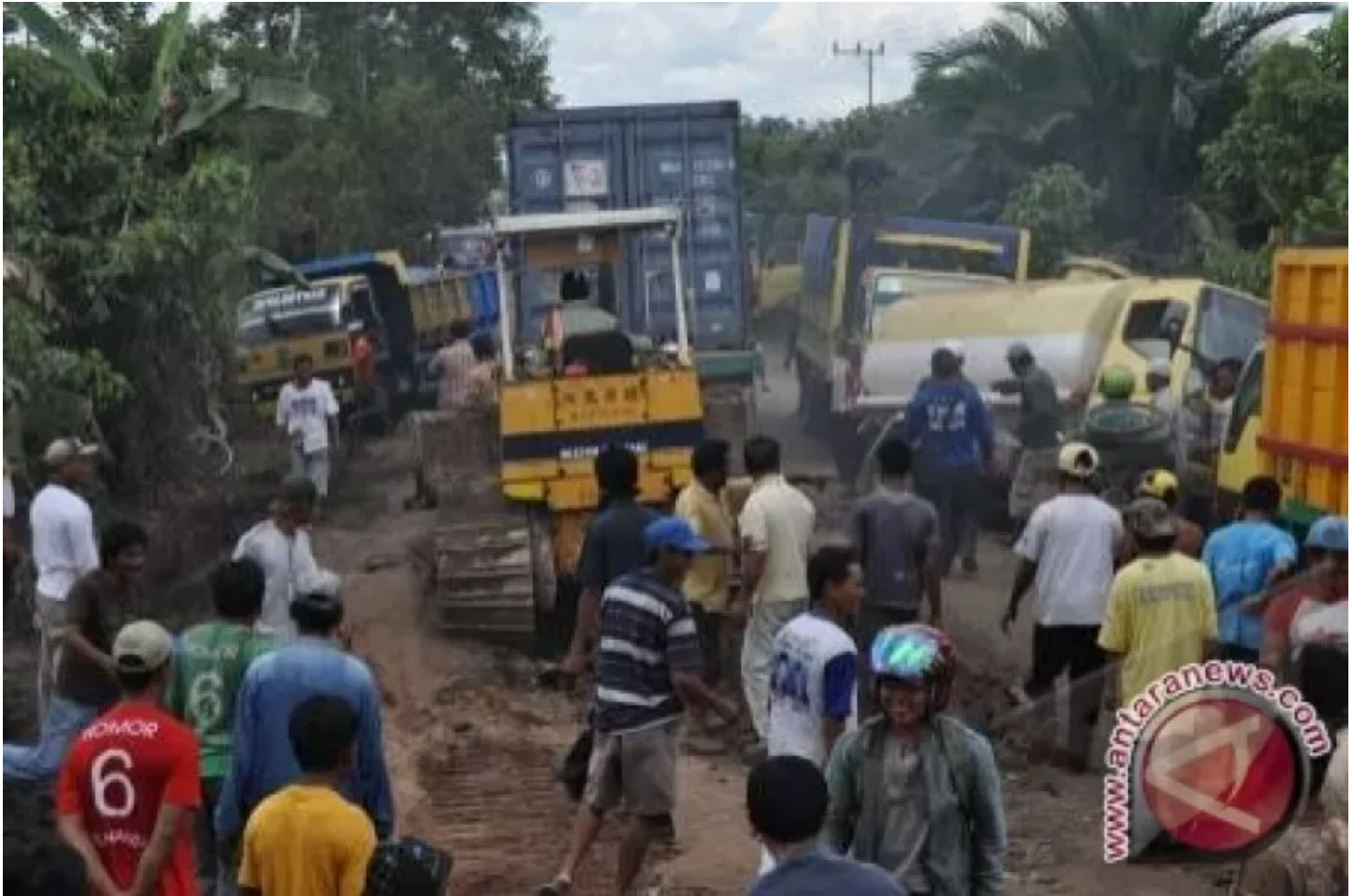
Ilustrasi, Jalan Rusak ( www.antarafoto.com/FOTO ANTARA/Untung Setiawan ). Istimewa

( https://kalteng.antaranews.com/berita/225711/perusahaan-ingkar-janji-perbaiki-jalan-harus-disikapi ) © Jumat, 13 Desember 2013 23:55 WIB