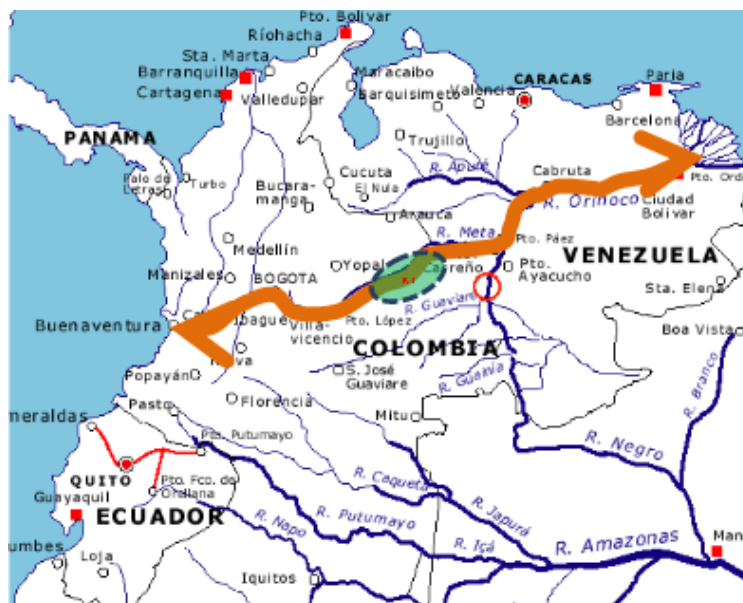
Figura 2. Eje de integración regional que incluye a la Altillanura colombiana