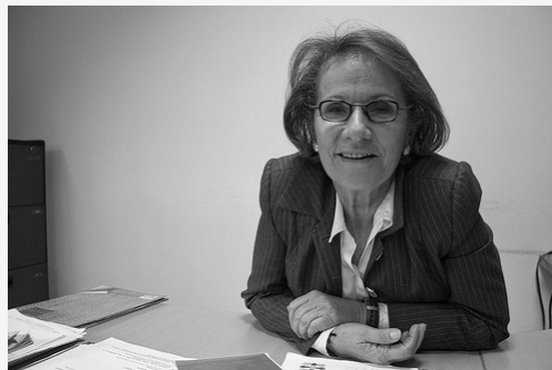
Varios de los casos de compra de baldíos están siendo investigados en el Incoder que dirige Miriam Villegas, que heredó la tarea de adjudicarlos del antiguo Incora.