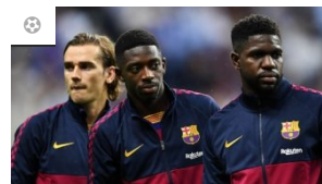
Barcelona vs Slavia Praha, Valverde Bawa Umtiti dan Dembele