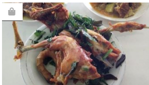
Sajian Unik Khas Aceh Itu Bernama Ayam Pramugari, Sudah Pernah C...