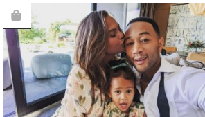
Saat Masih Pendekatan, Chrissy Teigen Akui Sering Stalking John ...