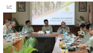
Mentan : Sektor Perkebunan Jadi Andalan Devisa dan Kesejahteraa...