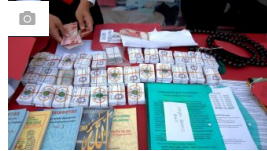
Begini Bentuk Tiket Masuk Surga