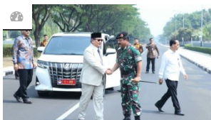
Mobil Menhan Prabowo: Komparasi MPV dengan Sedan, I...