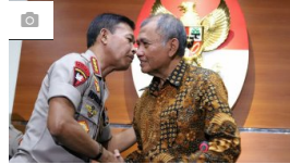
Kapolri Temui Ketua KPK Bahas Sinergi Pemberantasan Korupsi