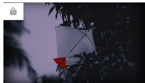
Kisah Layangan Putus, Suami yang Hilang Rupanya Honeymoon den...