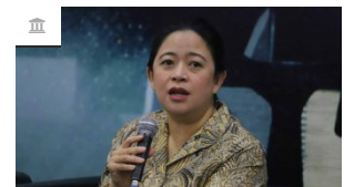
Puan Maharani Pimpin DPR ke Pertemuan G20 di Jepang