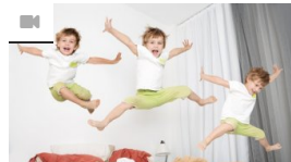
Can Affect Intelligence, Here's How to Maintain Children's Intestine Health