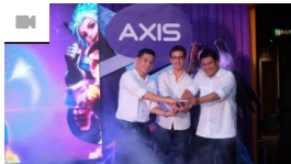
Peluncuran Fitur Baru di Aplikasi AXISnet