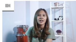
Zodiac Zone: In November Many Zodiacs Ended Love