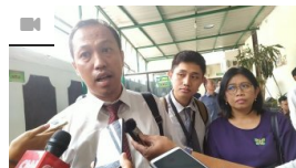
File Not Complete, Gonzaga High School Student Session Held Postponed