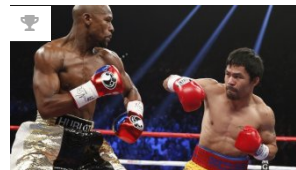
Tinju Dunia: Marquez Cibir Rencana Duel Ulang Pacquiao vs ...