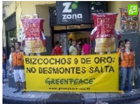
Los activistas de Greenpeace realizaron protestas en Rosario y Córdoba.

Córdoba y Rosario, 5 de febrero de 2014.- La organización ambientalista denunció hoy que los propietarios de la empresa que produce los Bizcochos 9 de Oro (1), pretenden desmontar más de 6.000 hectáreas de bosques salteños protegidos por la Ley de Bosques.