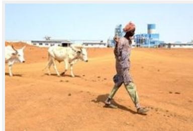
La société Senhuile, qui au départ devait produire du biocarburant, s'est accaparé 20 000 hectares de terres au Sénégal, au détriment des éleveurs locaux.