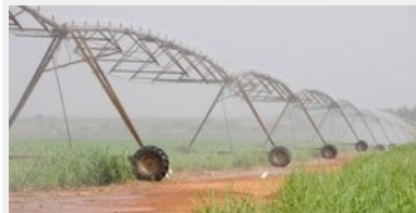
Alteo, l'un des plus importants groupes sucriers de Maurice, vient de finaliser sa prise de participation dans une entreprise sucrière kényane.