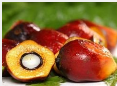
Un projet de palmier à huile dans le district de Kisaware connaît actuellement un regain d'intérêt de la part des officiels après le silence qui avait prévalu à son endroit durant les deux dernières années.

The Declaration of the Global Convergence of Land and Water Struggles launched in Dakar at the African Social Forum in October 2014 and reworked in Tunis at the World Social Forum in March 2015 is open for signature and engagement.