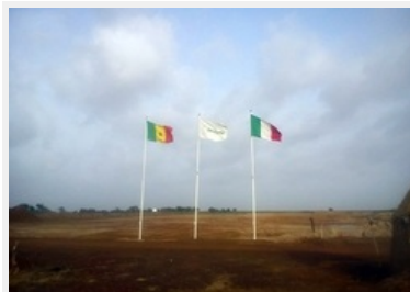
Senhuile invoque des motifs économiques pour expliquer une série de licenciements dans son service