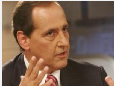
El Ministro de Agricultura, Juan Camilo Restrepo, aseguró que habrá más regulaciones.

Hace algunos meses, la multinacional estadounidense Cargill -la mayor comercializadora del mundo de materias primas agrícolas- emprendió en la altillanura colombiana un proyecto de producción de cereales que involucra 90.000 hectáreas en el departamento del Meta, y ya invirtió 100.000 millones de pesos en la compra de tierras.