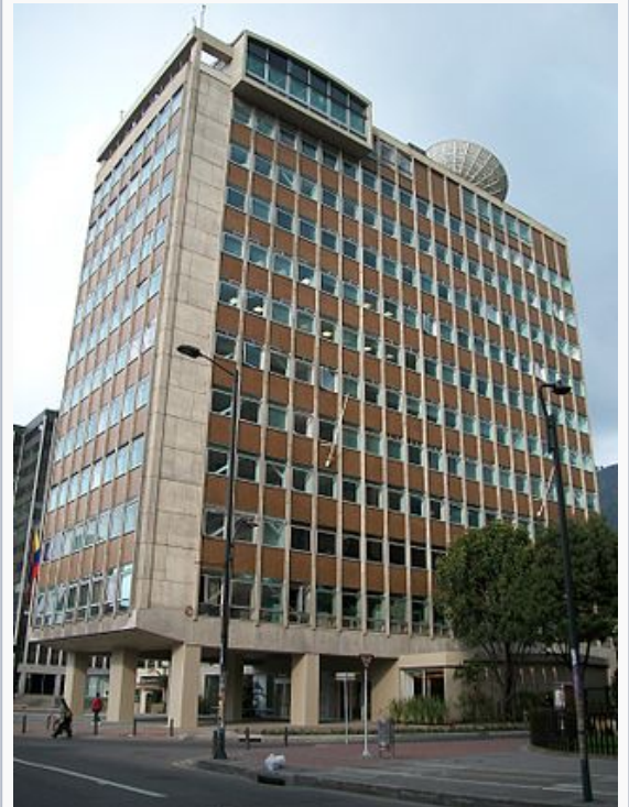
Edificio principal en Bogotá