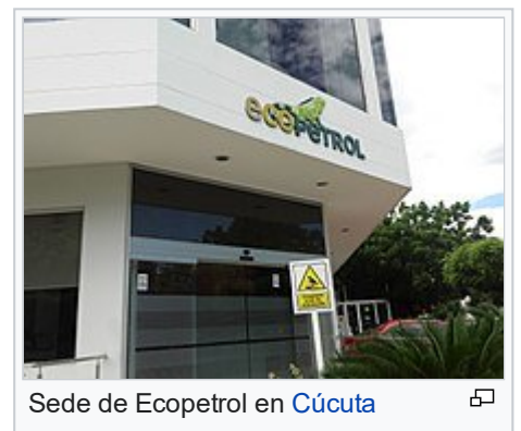
Sede de Ecopetrol en Cúcuta

La empresa surgió de los activos revertidos de la Concesión de Mares 12 que adjudicó el presidente Rafael Reyes Prieto a la Tropical Oil Company, la cual empezó a operar en 1921 el pozo Infantas 2 y la posterior puesta en producción del Campo La Cira-Infantas , ubicado a 22 km al sur de la ciudad de Barrancabermeja y a unos 300 km al nororiente de Bogotá.