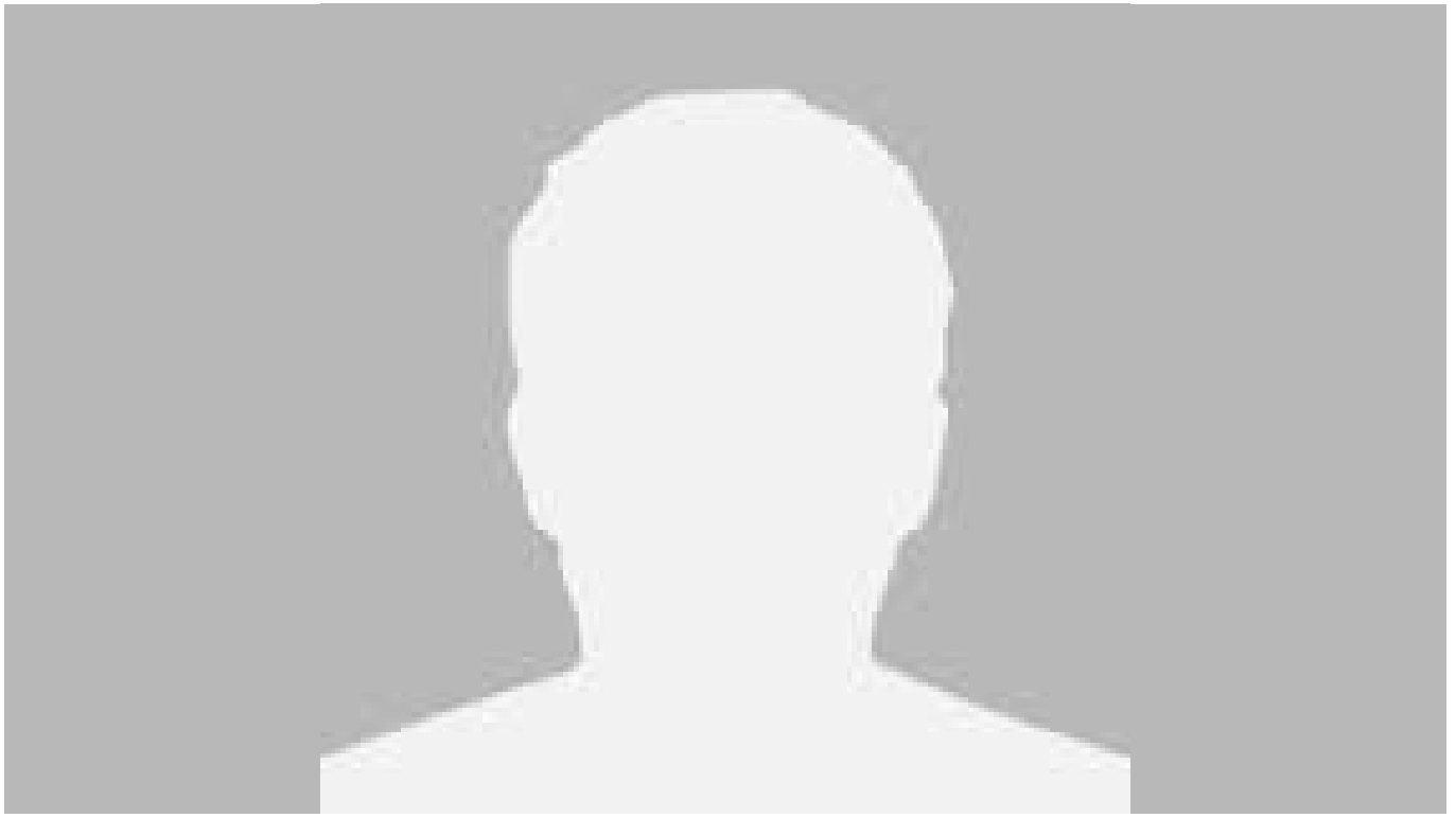
Apropiaciones en el sur de salta