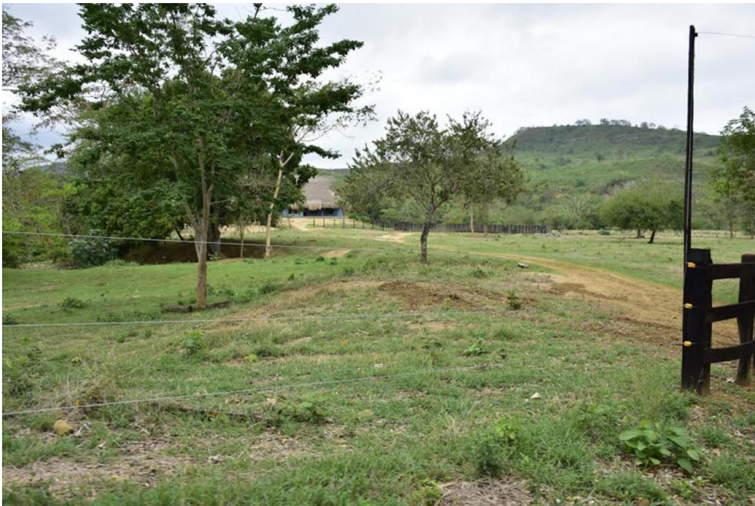
Aspectos de una finca en la zona de Barcelona.