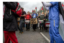
Gaza y lo inhabitable