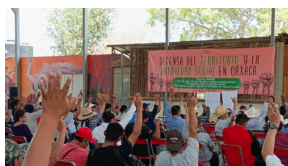
Foro Defensa del Territorio de Oaxaca denuncia mercantilización de la tierra