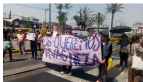
Denuncian represión policial y detenciones arbitrarias contra mujeres de Nos Queremos Vivas Neza