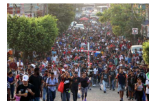
La condición política de las migraciones forzadas y crítica de la criminalización de poblaciones extranjeras