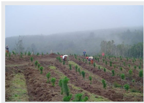
Monocultivo de pinos Comaco.

La Compañía Agrícola de la Sierra S.A., constituida por capitales chilenos, fue inscrita en Panamá el 19 de septiembre de 2006. El aporte de capital inicial fue de US$ 18 millones, el cual fue dividido en 100 acciones comunes con un valor de US$ 180.000 cada una.