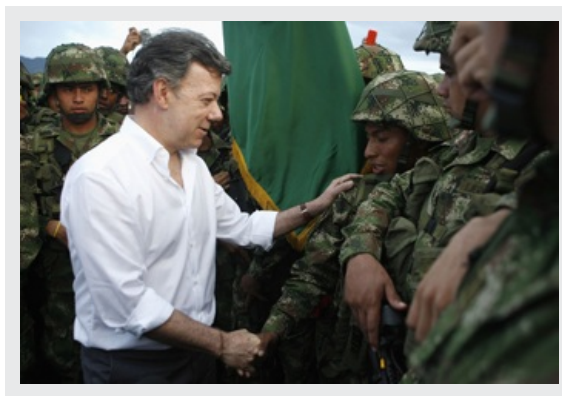
Juan Manuel Santos, presidente de Colombia

El acercamiento entre el gobierno y la guerrilla ha sido objeto de duras críticas desde la oposición. Las más fuertes han salido desde el mismo expresidente Álvaro Uribe quien en agosto del 2012 calificó de “bofetada a la democracia” el inicio de diálogo formal con las FARC impulsado por el Presidente Juan Manuel Santos. Recientemente Uribe llegó incluso a acusar la supuesta responsabilidad penal que le cabe a aquellos que se reúnen a dialogar con grupos armados fuera de la ley. Ayer miércoles y luego de cinco meses de discusión, el gobierno y las FARC alcanzaron un acuerdo parcial para garantizar la participación del grupo rebelde en política. Este era el segundo de los cinco puntos a negociar en medio de las conversaciones de paz iniciadas en noviembre del año pasado en La Habana.