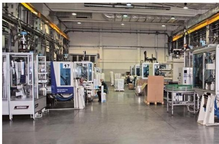
ТОВ «Пласт-бокс Україна»

У нашій області є приклади результативного застосування іноземного капіталу – так звані історії успіху. До них можна віднести ПрАТ «Тютюнова компанія «В.А.Т.-Прилуки» – Бритіш Америка Тобакко Україна» (німецькі інвестиції); ТОВ «Адам Компані» (грузинські інвестиції); ТОВ «Новофіл» – єдиний в Україні виробник оплетеної еластичної нитки (талійські інвестиції); ТОВ «Агрікор-Холдинг» (кіпрські інвестиції); ТОВ «Пласт-бокс Україна» (польські інвестиції); ТОВ «Мейн Пак» (британські інвестиції); ТОВ «Папернянський кар'єр скляних пісків» (болгарські інвестиції); завод із виробництва продуктів глибокого заморожування «Фортетті-Україна» (угорські та британські інвестиції).