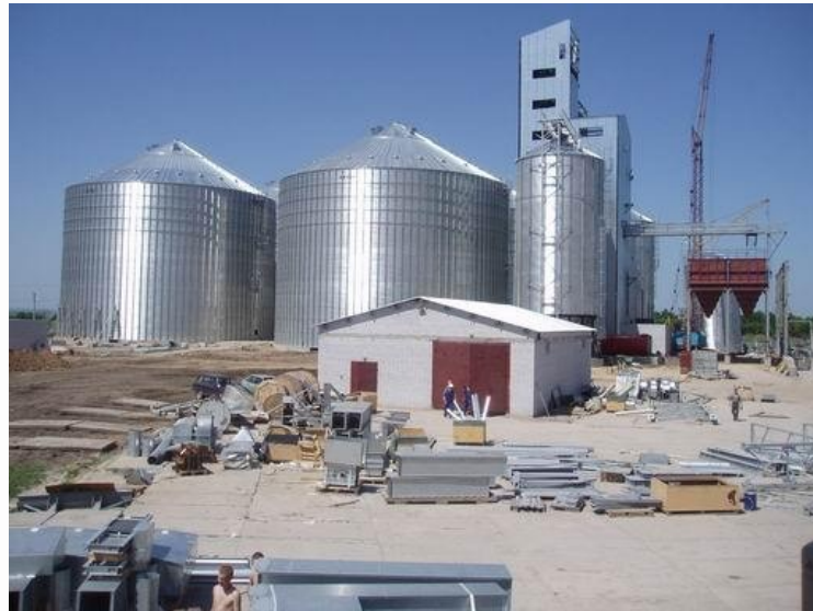
ТОВ «Чернігівський елеватор»

Наразі суб'єкти господарювання в області активно залучають для розвитку виробництва позабюджетні ресурси, міжнародну технічну допомогу, гранти. Зокрема, Чернігівська облдержадміністрація виступає бенефіціаром таких проектів: ЄС/ПРООН Місцевий розвиток, орієнтований на громаду - III фаза», ПРООН «Clima East: збереження та стале використання торфовищ», ЄС Українська регіональна платформа громадських ініціатив», ЄС/SUDEP Модернізація вуличного освітлення у м. Мена».