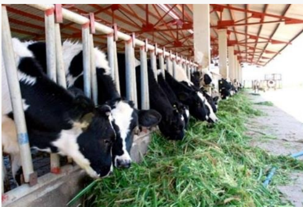
Khánh thành dự án nuôi bò giống và bò thịt lớn nhất tỉnh Hà Tĩnh.

BNEWS.VN Ngày 15/1, Công ty cổ phần Chăn nuôi Bình Hà đã khánh thành giai đoạn I dự án chăn nuôi bò giống, bò thịt tại xã Cẩm Quang, huyện Cẩm Xuyên tỉnh Hà Tĩnh.