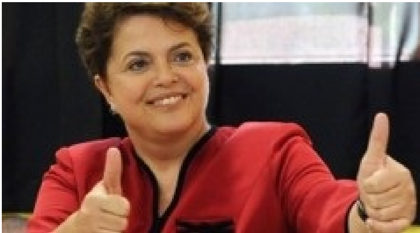
Aumento no uso de biodiesel é sancionado por Dilma Rousseff