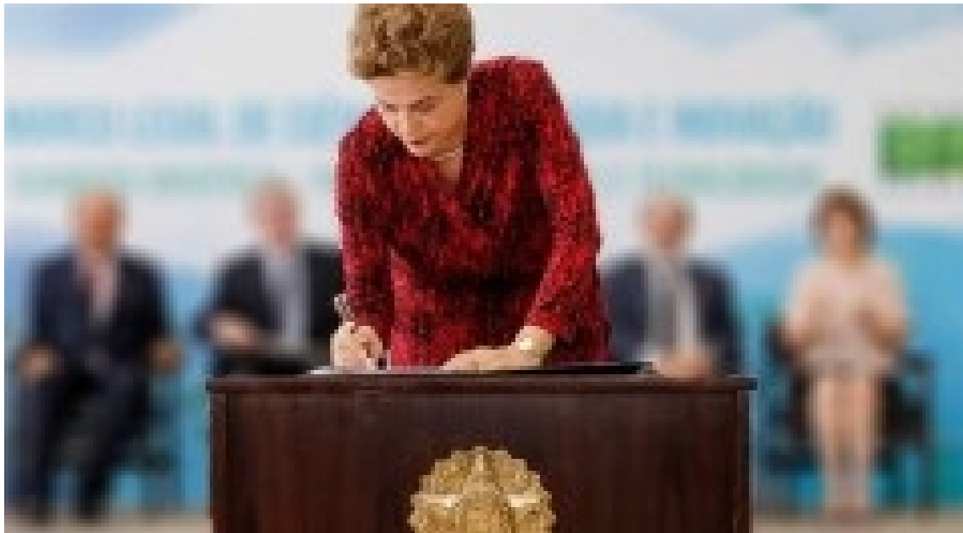
Sanção presidencial do B10: Cobertura ao vivo