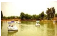
Khai thác tốt tiềm năng để du lịch phát triển - Kỳ cuối