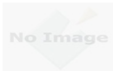
Một số dự án đầu tư công năm 2015 được điều chỉnh tăng vốn