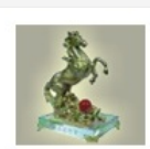
Vật phẩm phong thủy Hồng Phước