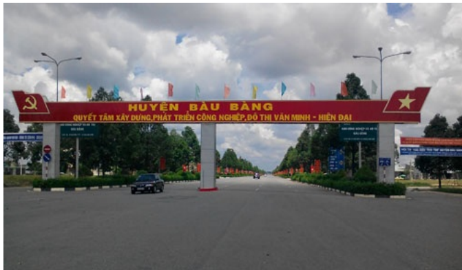
KCN - đô thị Bàu Bàng được đầu tư hạ tầng đồng bộ để thu hút các nhà đầu tư. Trong ảnh: Cổng vào KCN - đô thị Bàu Bàng.

Thời gian qua, Bình Dương đã nỗ lực đầu tư xây dựng hạ tầng Khu công nghiệp (KCN) - đô thị Bàu Bàng (huyện Bàu Bàng) nhằm bảo đảm thu hút đầu tư và ổn định đời sống người dân sau thu hồi đất, qua đó góp phần hoàn thành mục tiêu đưa Bàu Bàng trở thành trung tâm công nghiệp - đô thị ở phía bắc của tỉnh.