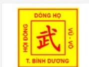
Hội đồng dòng họ Vũ - Vũ Việt Nam