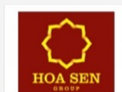
Công ty Cổ phần Tập đoàn Hoa Sen