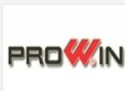
Công ty TNHH Nam Bình