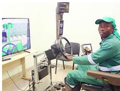
Uno de los trabajadores de la compañía hace prácticas en el simulador