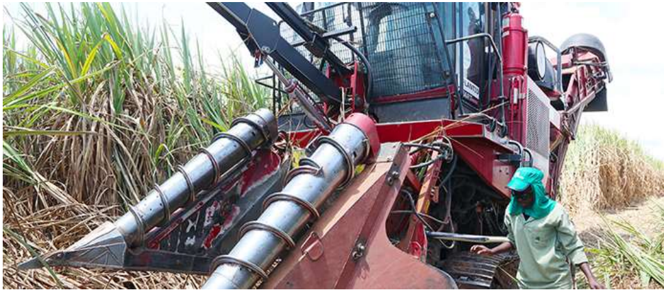
Operario trabajando en los campos de cultivo de caña de azúcar de BIOCOM

LA EMBAJADA (../EMBAJADADEANGOLA-LA-EMBAJADA-BIOGRAFIA.HTML) CONSULADO (../EMBAJADADEANGOLA-CONSULADO.HTML) ANGOLA (../EMBAJADADEANGOLA-ANGOLA.HTML) INFORMES ECONÓMICOS (../EMBAJADADEANGOLA-INFORMES-ECONOMICOS.HTML) VIAJAR A ANGOLA (../EMBAJADADEANGOLA-VIAJAR-A-ANGOLA.HTML) SALA DE PRENSA (../EMBAJADADEANGOLA-PRENSA.HTML)