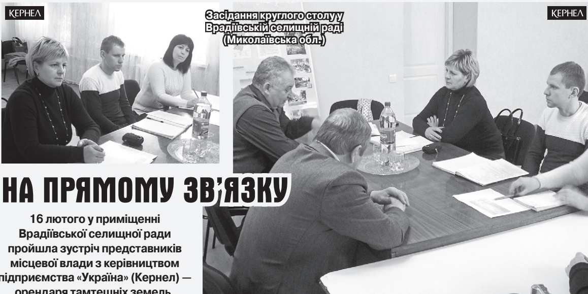
Засідання круглого столу Врадівський селищний рад (Миколаївська обл.)