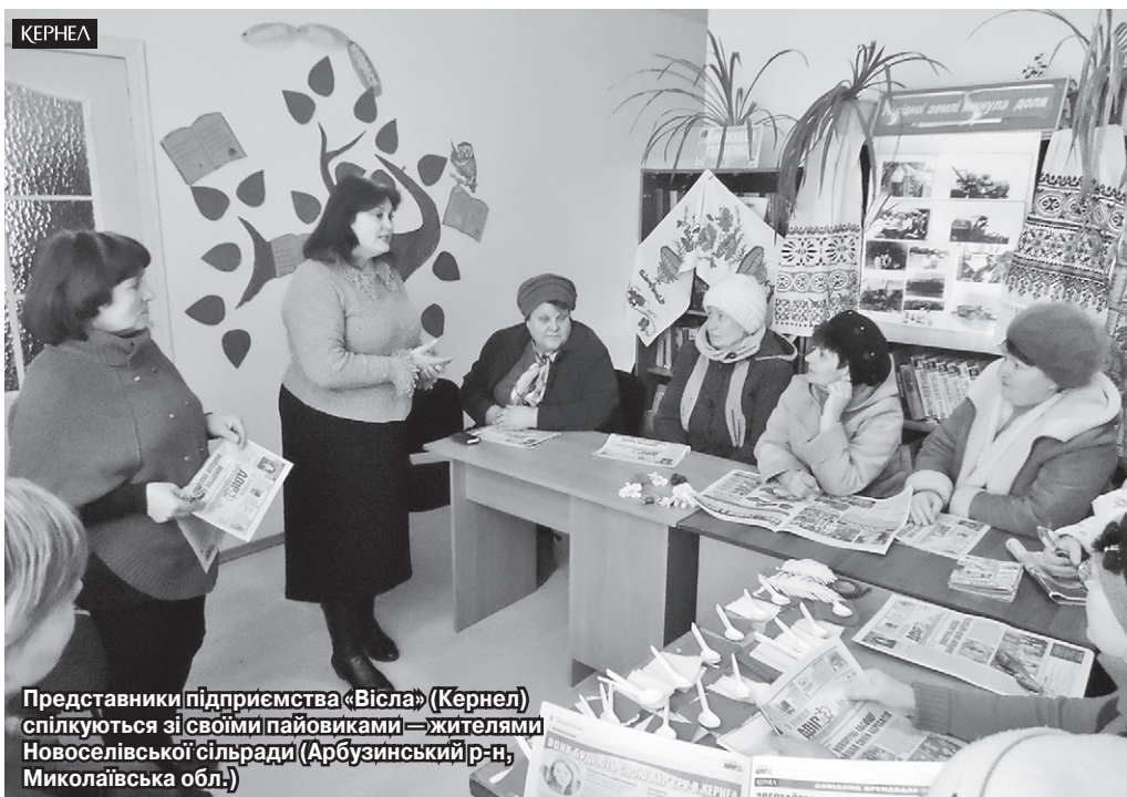
Представники підприємства «Вісла» (Кернел) спілкуються зі своїми пайовиками — жителями Новоселівської сільради (Арбузинський р-н, Миколаївська обл.)