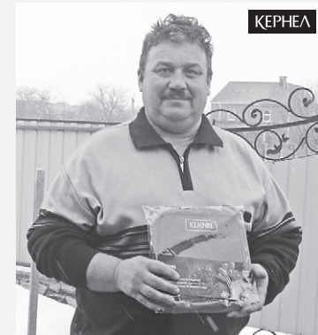
Учасники війни в Афганістані приймають вітання від Кернел

Щороку представники компанії Кернел вітають учасників війни в Афганістані. Цьогоріч привітальні листівки та корисні презенти від кернелівців отримали 45 воїнів-інтернаціоналістів — жителів сіл Кіровоградської, Черкаської, Вінницької, Миколаївської областей. Для Кернел це вже стало доброю традицією. Хочемо ще раз подякувати цим мужнім чоловікам! Залишайтеся й надалі взірцями патріотизму!