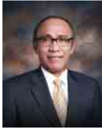
Fuady Thaher Commissioner